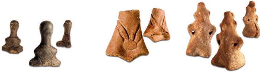
сл.15. Седечка фигурина со стилизиран лик и детали од облека, Утока на Дрим, Струга