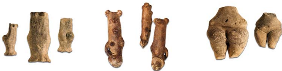
сл. 3. Стоечка фигурина со назначени женски атрибути, Ангелци, Струмичко сл. 22. Женска фигурина со фризура со три кока, Породин, Битолско сл. 14. Реалистична женска фигурина, Сенокос, Прилепско