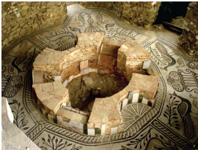
СЛИКА3 Стоби, мозаичен под од крстилницата во Епископска базилика

Во таа смисла голема блискост во основната претстава на афронтираните