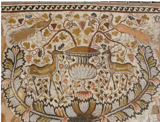
СЛИКА4 Хераклеја Линкестис, мозаичен под од наосот во Големата базилика

Со обемните систематски археолошки истражувања Хераклеја повторно го покажува својот урбан лик и неговиот развој низ периодите.