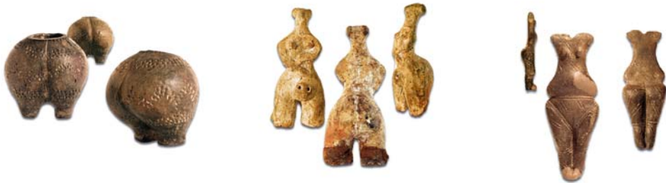
сл. 6. Антропоморфна фигурина – ваза, со нагласена стеатопигија, Таринци, Штипско