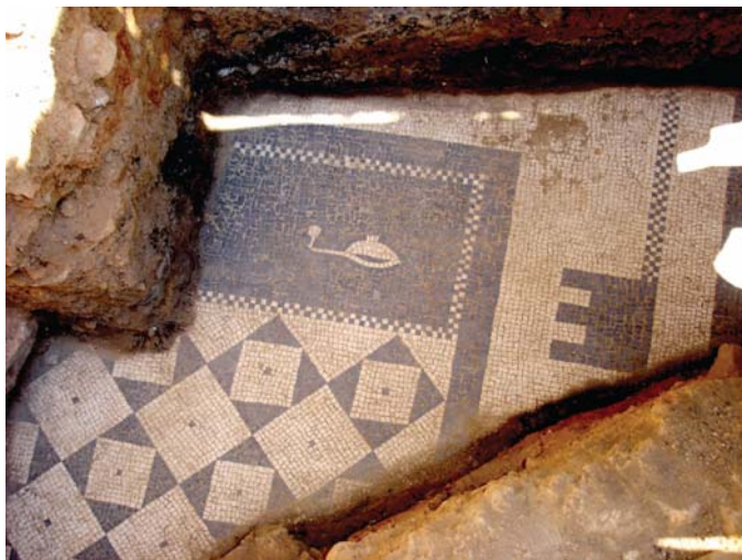
СЛИКА1 Охрид, Плаошник, Раноримски мозаик

Античкиот мозаик имал исклучиво декоративна функција, бил во служба на култот на царот, глорификувајќи ја моќта и сетилните уживања. Тој пред сè се развивал од орнаментално до илузионистичко прикажување. Најпознат е Александровиот мозаик во Помпеја, на кој е претставена битката помеѓу Александар Македонски и персискиот крал Дариј.