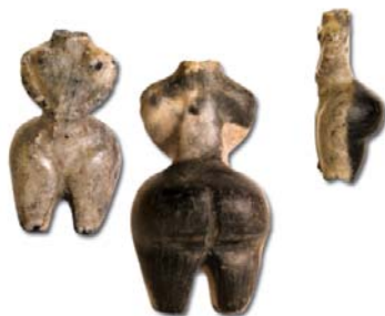
сл. 1 Мермерна фигурина, Тумба, Маџари

Од мноштвото откриени археолошки материјали многубројноста од пронајдените теракотни фигурици со претстава на жена од праисторијата, поточно од периодот на неолитот и енеолитот во Р. Македонија, ја наметна идејата да се соедини најголемиот број од нив и да се презентираат во една заедничка изложба насловена „Праисториските дами од Македонија“. 1 Тоа беше обид на едно место да се